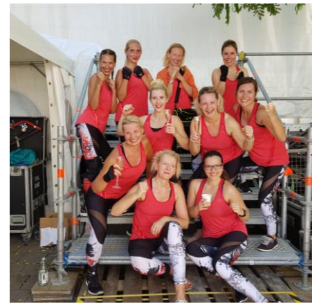
Juli 2019 - Hausherrenfest Radolfzell