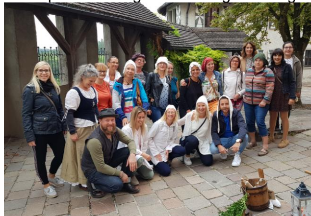
Sep 2019 – Engen Bademagd Ausflug