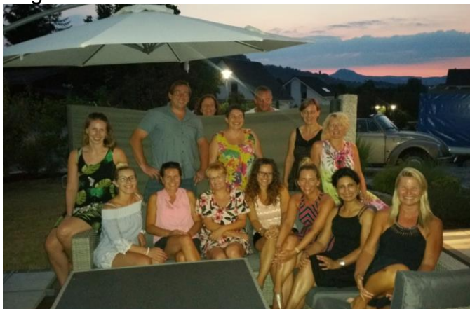
Aug 2019 – Hausen Grillfest